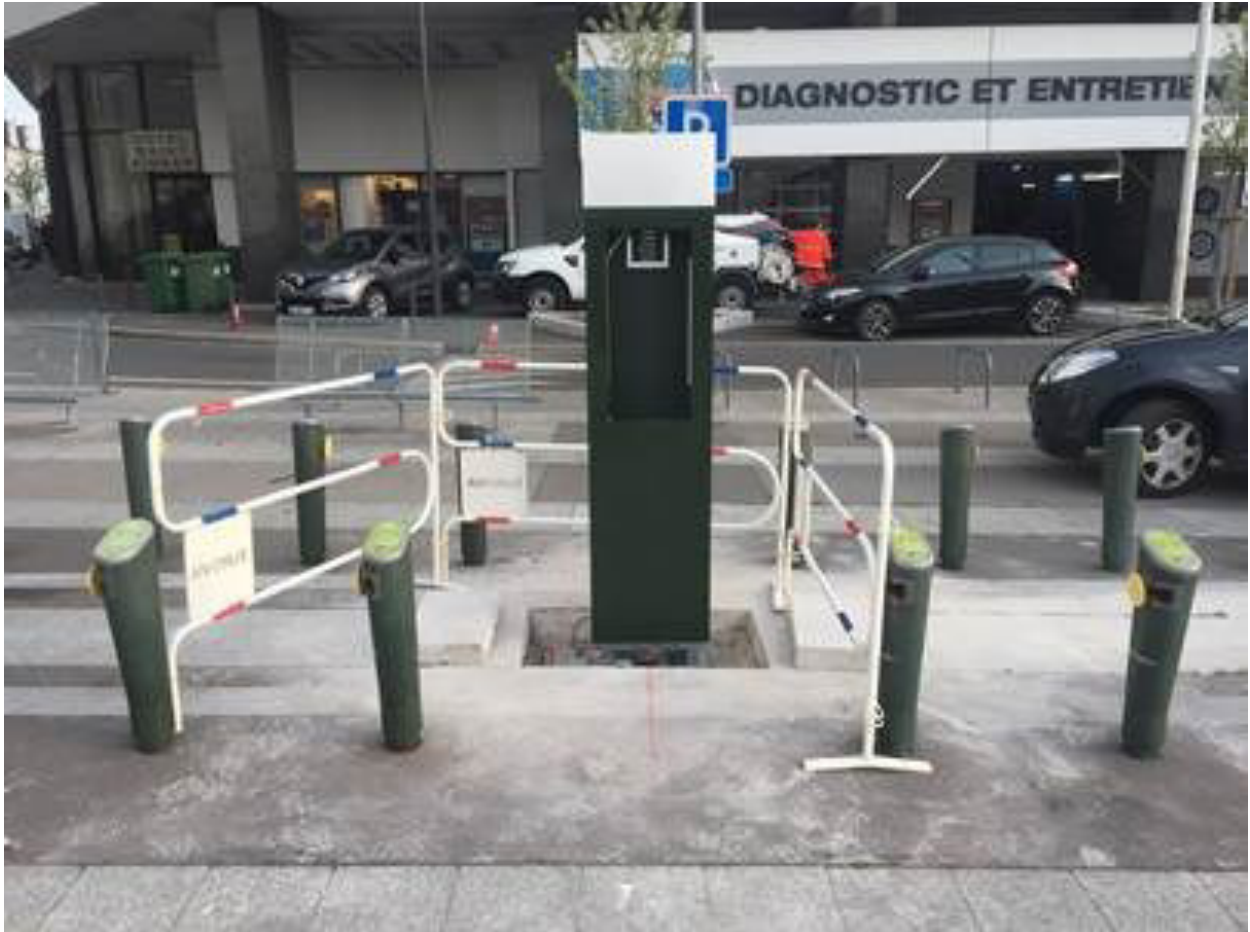
Travaux à la station Médiathèque