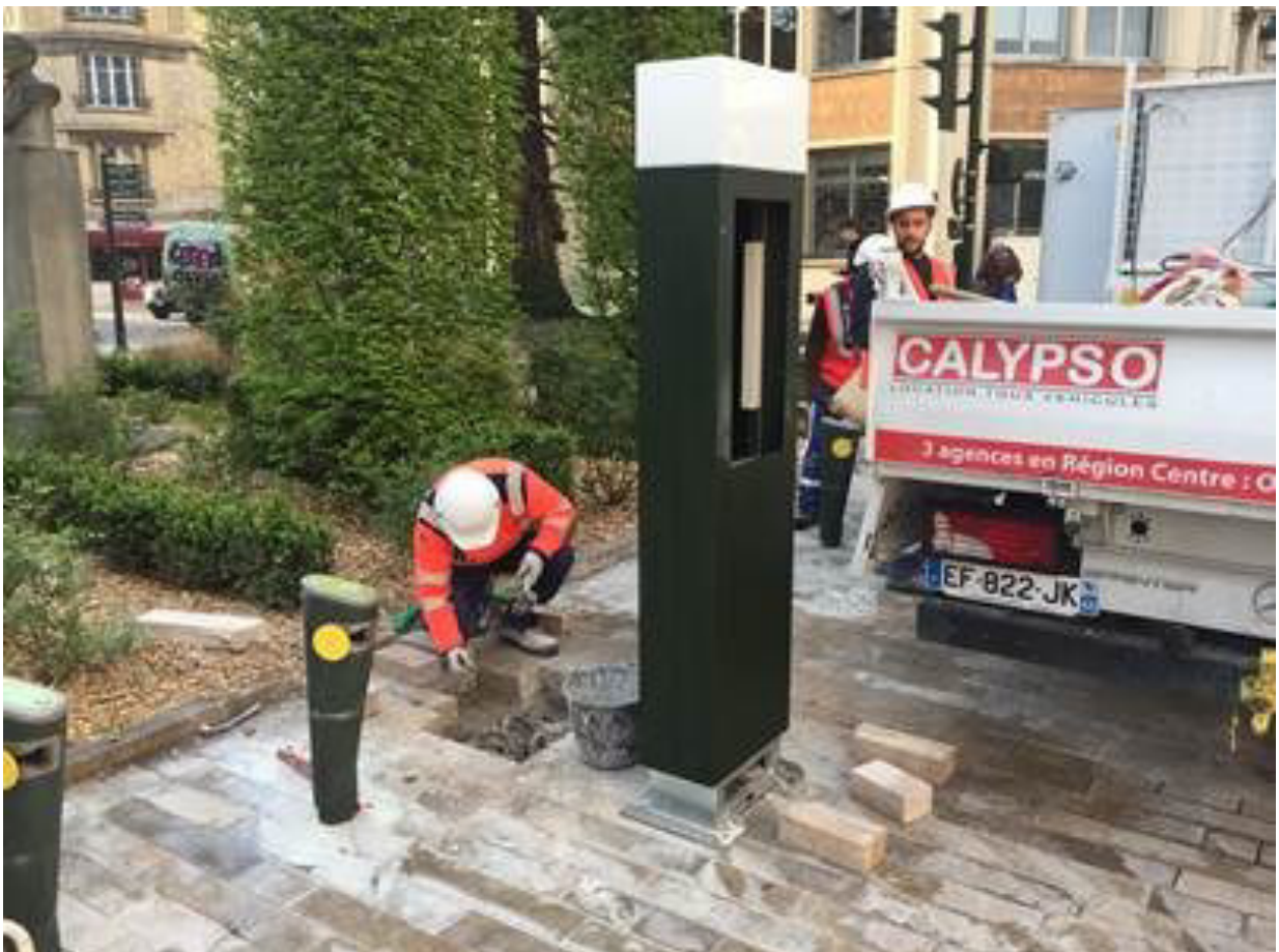
Réfection des sols à la station Halmagrand