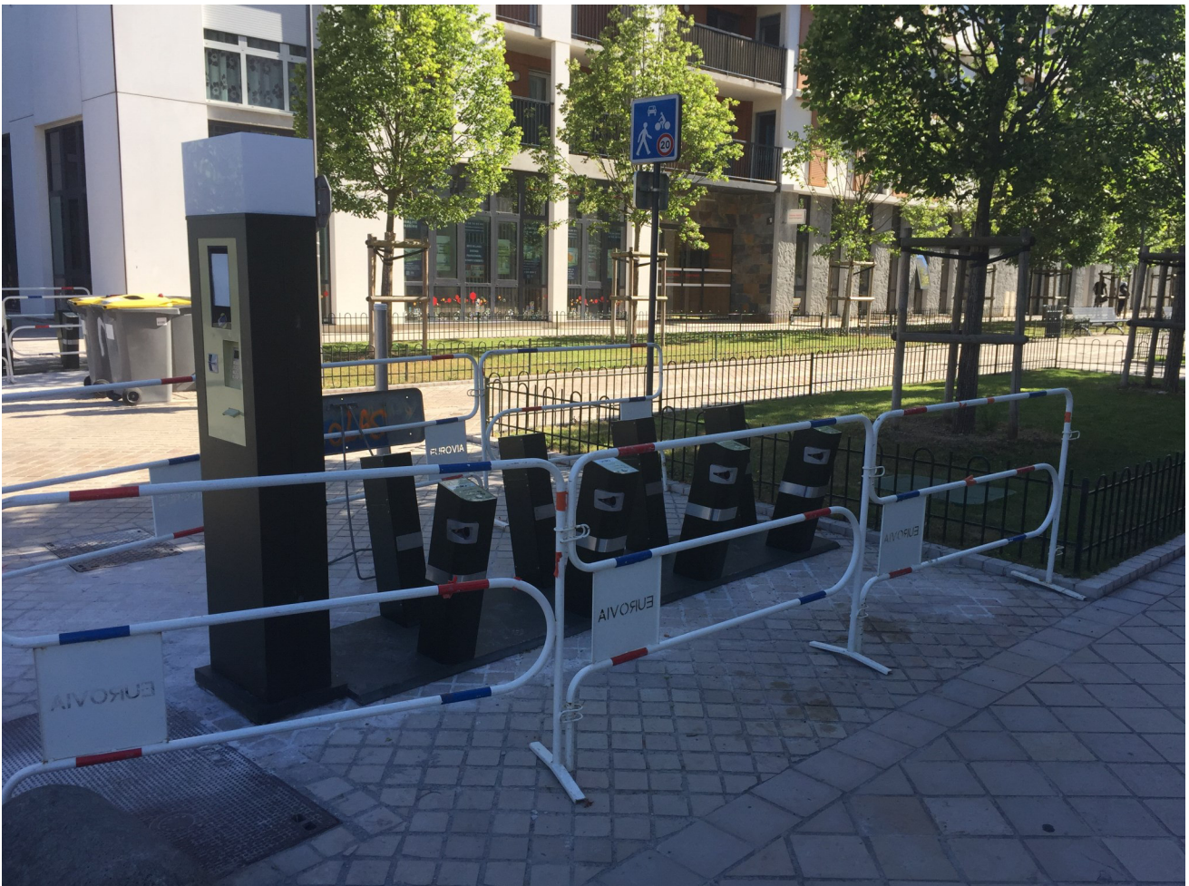
Construction de la station Sonis avec le nouveau mobilier Cycleo