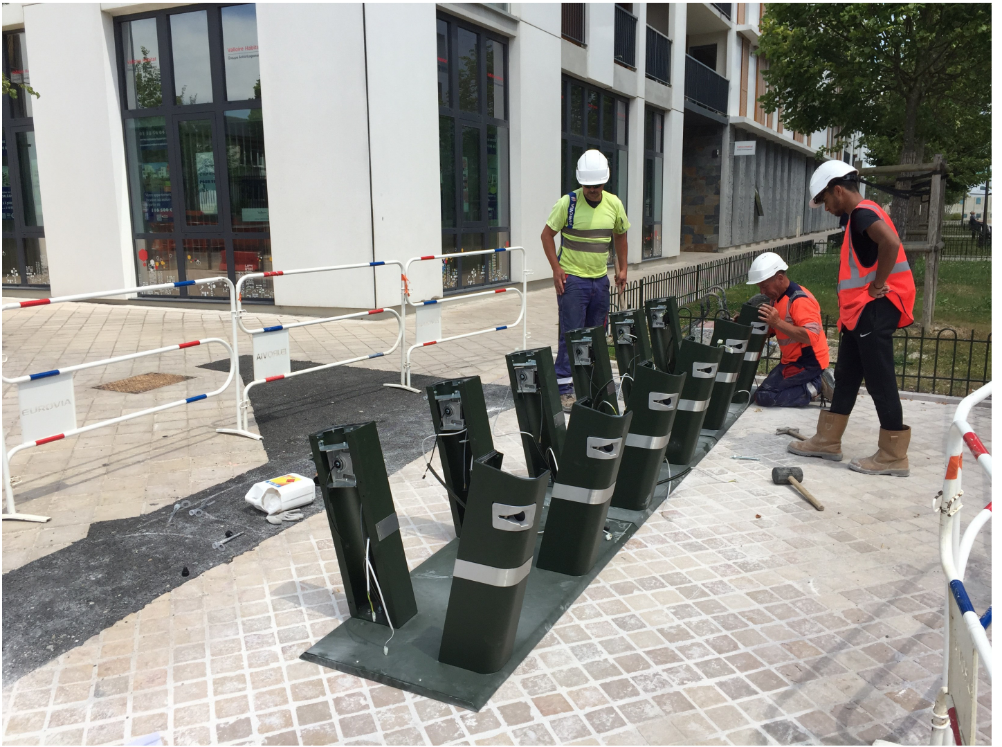
Installation des bornettes de la station Sonis