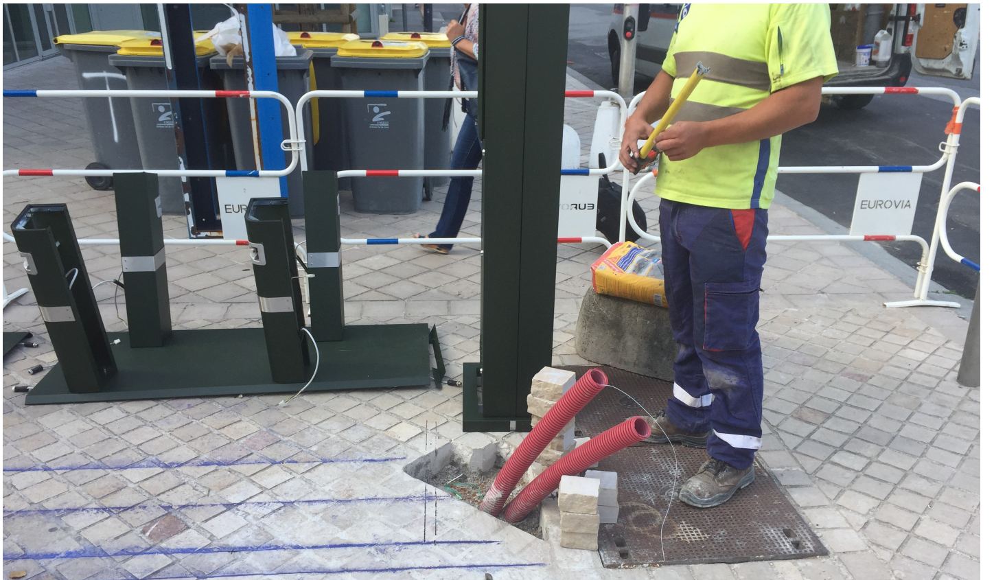
Tirage de câbles station Sonis