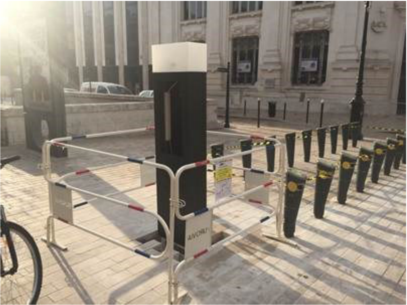
Intégration du bloc PC Place du Martroi