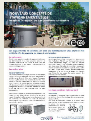
Fiche technique nouveaux concepts de stationnement vélos