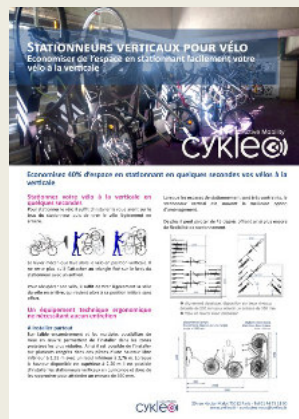
Fiche technique stationneurs verticaux pour vélo