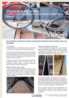
Fiche technique escalator et rangement automatique pour vélos