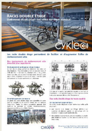
Fiche technique racks double étage pour vélo